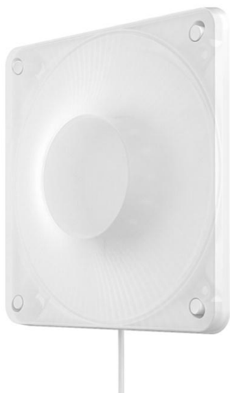
Рисунок 1 – Внешний вид.

Светодиодный светильник Geniled Public 15W является экономичным, долговечным и экологически безопасным светильником, конструктивные особенности которого позволяют использовать его для организации оптимизированного освещения на объектах ЖКХ, а так же объектах с агрессивными средами (производственные помещения, склады и т.д.).